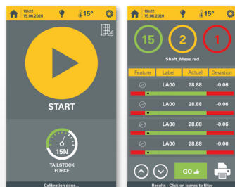
Nouvelle interface opérateur à écran tactile, facile à utiliser.