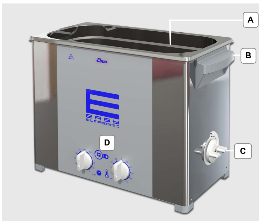
Bild 4.5 Vorderansicht Elmasonic EASY 30 H