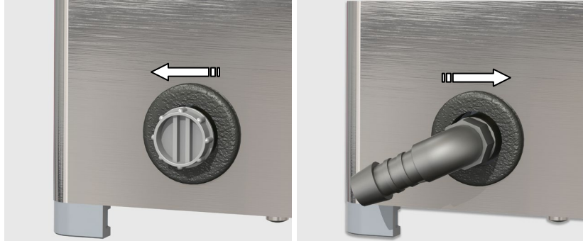
Bild 5.1.1 Ablauf mit Verschlussstopfen Auslieferungszustand