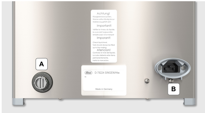
Bild 4.6 Ansicht Geräterückseite im Auslieferungszustand